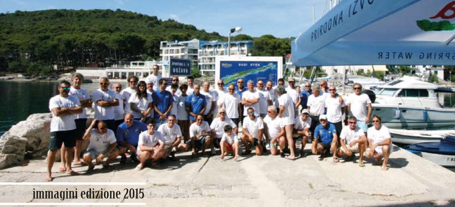
immagini edizione 2015