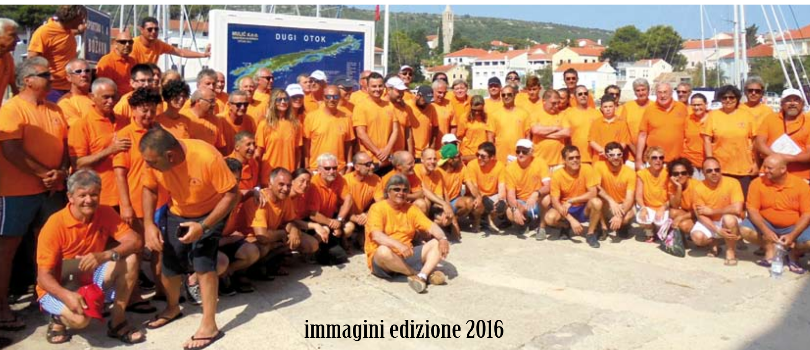
immagini edizione 2016